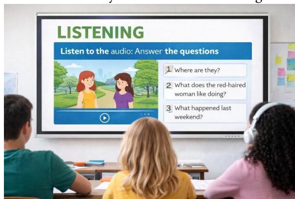
Figure 1. Classroom listening task supported by digital technology

Another relevant example is the use of a short video, such as a scene in which someone asks for directions. After the first viewing, students can answer simple questions like “Where does the person want to go?” or “What landmarks are mentioned?” . During a second viewing, the teacher can pause at key moments to highlight expressions such as “go straight” , “turn left” , or “across from” . In this way, listening becomes interactive, and students are actively involved in discovering how the language works.