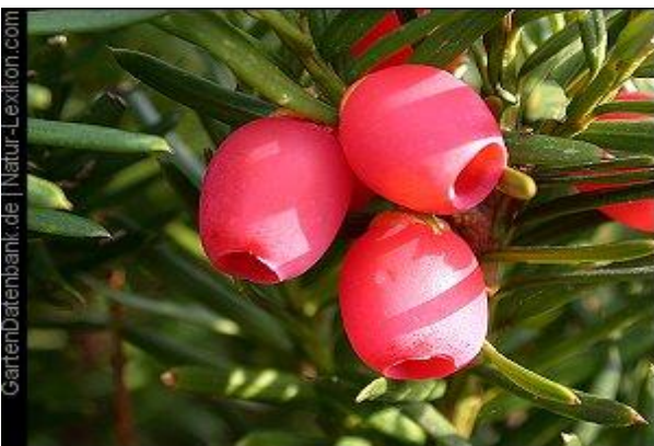
Fig.3. Taxus baccata-semințe cu aril cupuliform ( http://www.bota-nik.uni-bonn.de/conifers/ta/ta/baccata.htm )

Florile sunt unisexuate; plantele sunt dioice, cele masculine se dezvoltă în mugur încă din toamna precedentă, fiind constituite din 8-10 stamine, în formă de scut, pedunculate cu 5-9 saci polinici pe fața interioară; cele femele, înconjurată de trei perechi de solzi, solitare sunt așezate pe un lujer scurt, cu un singur ovul, terminal, erect. După fecundare la baza ovulului apare o excrescență cărnoasă, la început verde apoi roșie în formă de cupă numită aril. Fructifică destul de timpuriu și anual. [7]