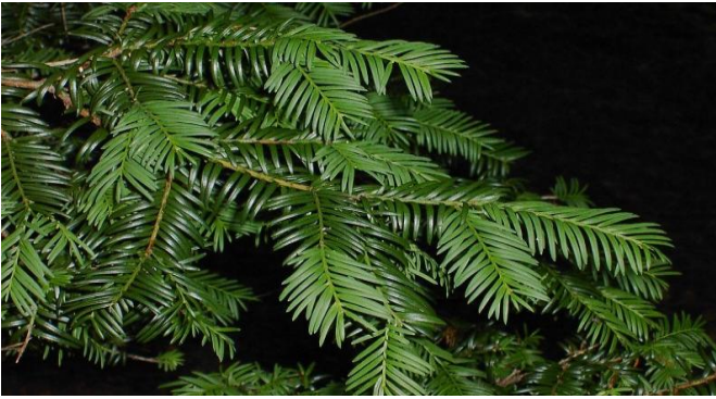
Fig.1. Taxus baccata – ramuri cu frunze

( http://www.conifers.co.nz/taxus/taxus.html )