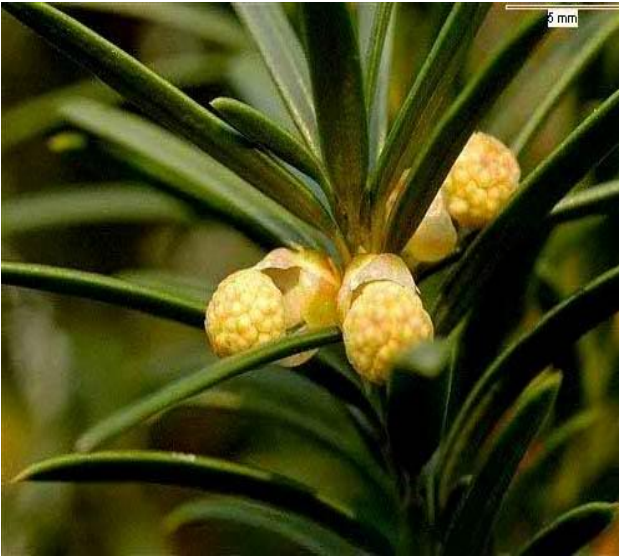
Fig.2. Taxus baccata-flori masculine

Acele liniar-lățite, plane, au lungimea de 2-3 cm și lățimea de circa 2mm, la bază abrupt îngustate într-un pețiol scurt, decurent pe lujeri, se aseamănă cu cele de brad, însă vârful lor este treptat acuminat, sunt mai moi, de un verde închis pe față și verde gălbui pe dos, fiind lipsite de dungi albe de stomate; stau dispuse în același plan (pectinat) și nu conțin canale rezinifere [1].