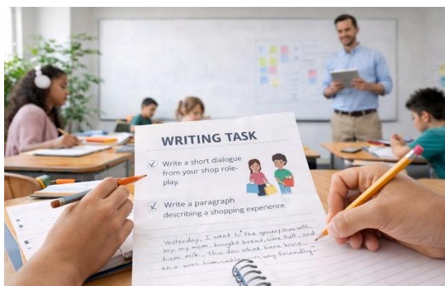
Figure 2. Students practicing writing in English

For instance, after the shop role-play, students may be asked to write a short dialogue or a paragraph describing a shopping experience. They can include the expressions they have learned, as well as their own ideas. This helps reinforce correct structures and encourages greater attention to language form.